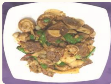
大吉大利 $20.88 (XO醬雜菌豬脷) Pig tongue in XO sauce