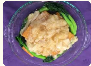
步步高昇 $22.88 (竹筴扒紅燒豆腐) Green veggies w/ bamboo pith