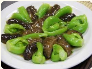
情比海深 $38.88 (紅燒海參) Braised sea cucumber w/ veggies