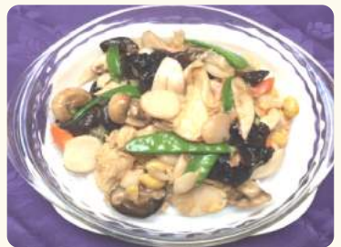
蘿漢上素 $20.88 Mixed mushroom