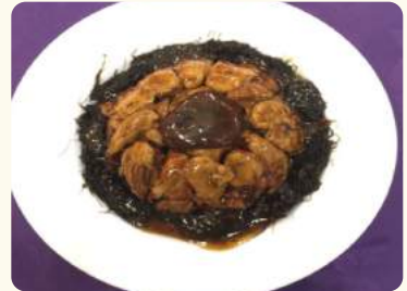
發財好市 $33.88 (髮菜燜蠔豉) Dried oysters w/ seaweed