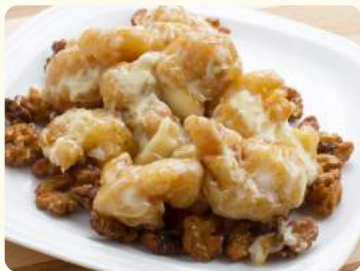
新年笑哈哈 $20.88 (西汁核桃蝦) Crispy walnut shrimp