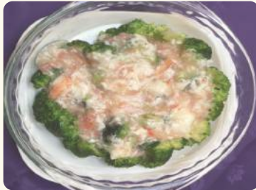
花開富貴 $22.88 (蟹肉扒時蔬) Broccoli with crab meat