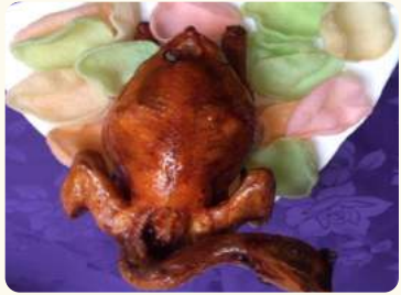
金雞報喜 $35.88 (當紅炸子雞) Deep fried chicken