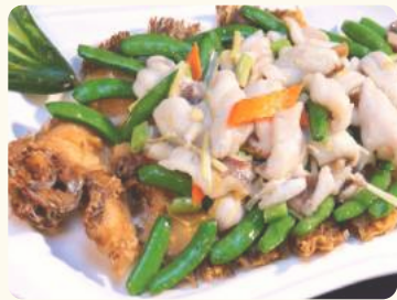
年年有餘 $35.88 (骨香龍利球) Fried whole fish (bone- in)