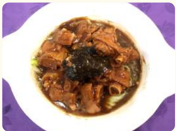
發財就手 $25.88 (發菜豬手) Pig feet w/ seaweed