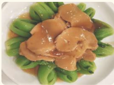
靈活可愛 $22.88 (靈芝菇時菜) Reishi mushroom with vegetables