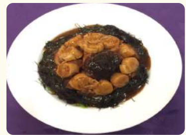
鴻運當頭 $35.88 (髮菜蒜子柱甫) Dried scallop w/ seaweed